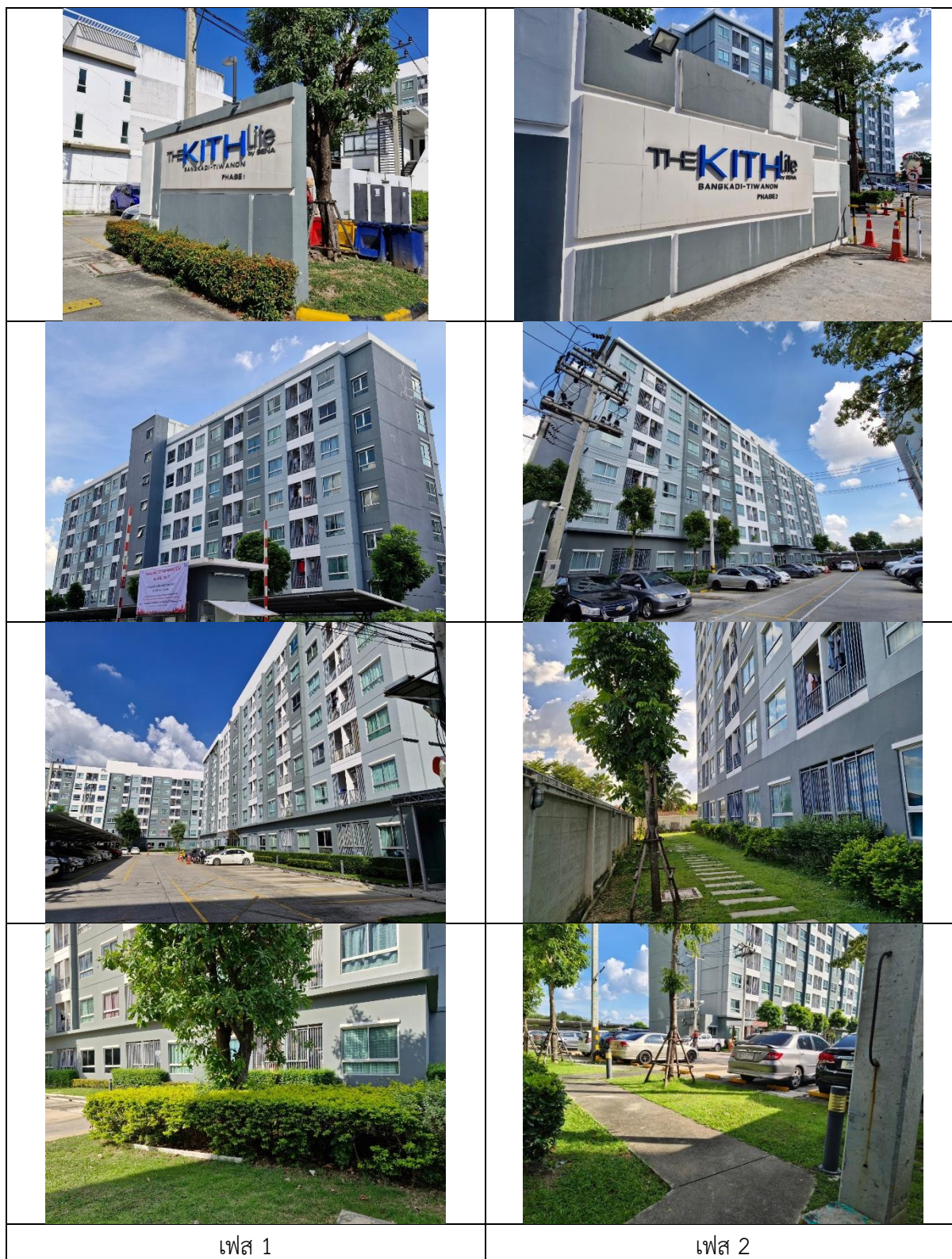
รูปที่ 1-4 สภาพแวดล้อมโดยทั่วไปโดยรอบโครงการ 19 พฤศจิกายน 2567